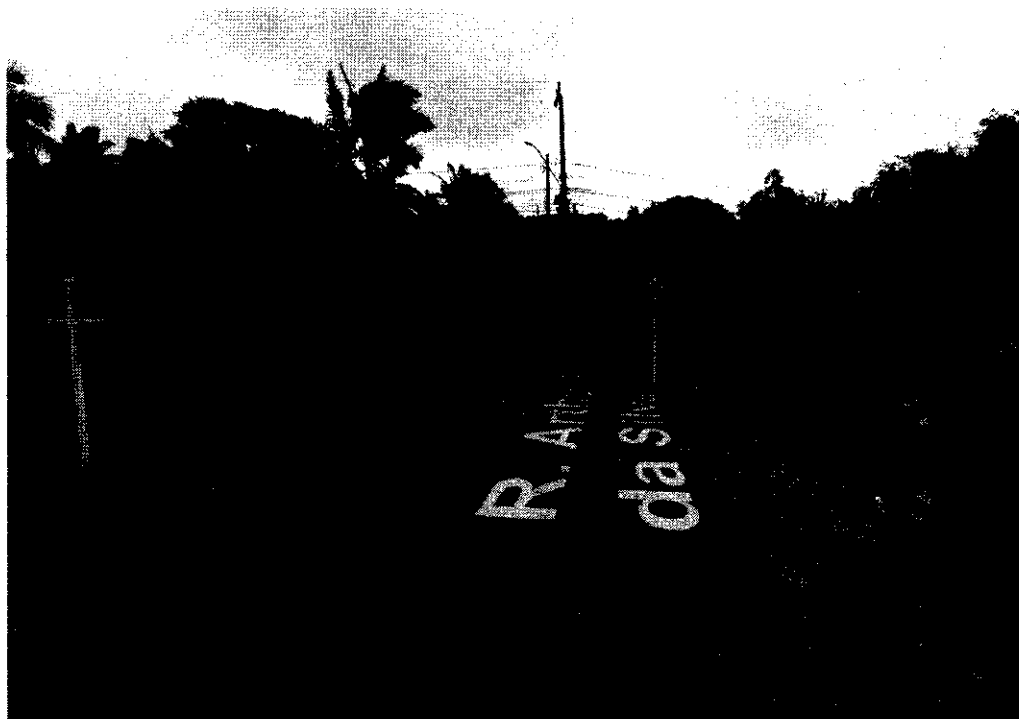
Início da rua, vista da RS 240

As medidas de Largura e Extensão deverão ser conferidas no local e poderão sofrer alteração em caso de necessidade.